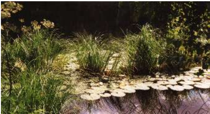
Sommergarrensee foto af

den Himmel zu spiegeln und die unterirdischen Quellen eines Heiligen See's (Garrensee) zu speisen