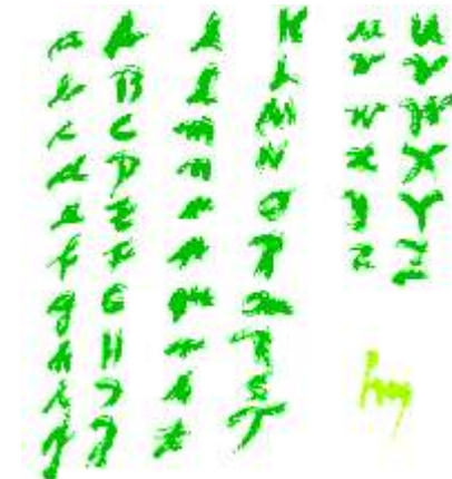
Im Namen Der L i e b e nel nome Dell' a m o r e