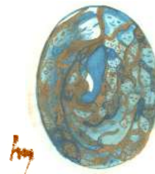
Lebensbilder mit Elefant

erweckte sie zum Leben mit dem Ank - Kreuz