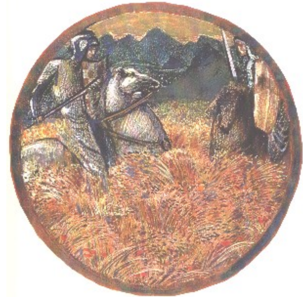
Saturn Loathing - Edward Brune-Jones der Fluch des Saturn

ein Schrecken für den Erdgott: bewaffnete Männer treffen in einem Kornfeld zum Kampf aufeinander - das reife Getreide unter den Hufen der Pferde zertrampelnd