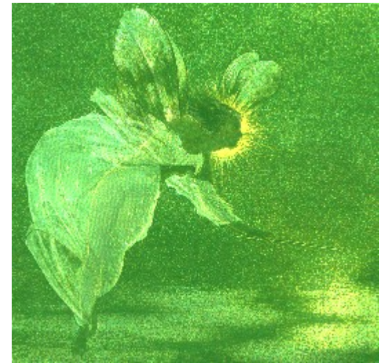
Feenlicht - Spirit of the Night

Wir danken mit einem freudigen Annehmen und Weiterschenken