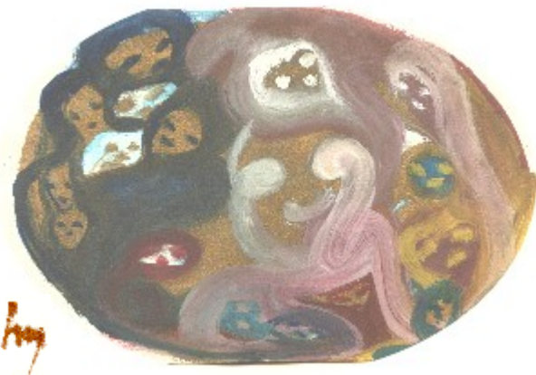
Venus - Liebe

ich gebäre ES in der Freude Meines Seins