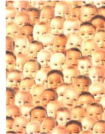
Kinder der Erde

Alle schenken ihren Duft warmer Herbstluft einatmen - genießest - danken