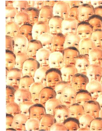
Kinder der Erde

Totale Wärme - ganz viel Liebe - Schönheit der Erde im Universum des Herzens gespürt