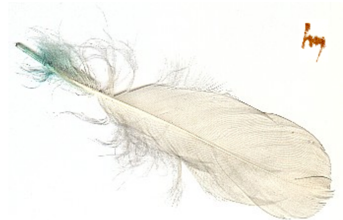
Feder - leicht

Schlägt Dir die Hoffnung fehlt, nie fehle Dir das Hoffen! Ein Tor ist zugetan, doch tausend sind noch offen