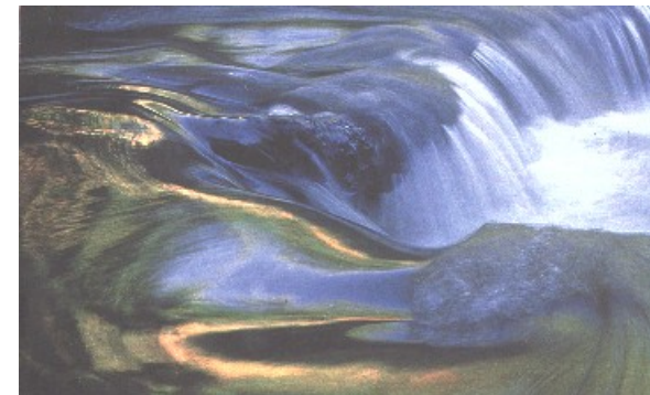
Hot springs- auch Thermalwasser

ich finde meinen Weg, meine Lebensarbeit, mit der ich Mut und Kraft und Freude leben kann