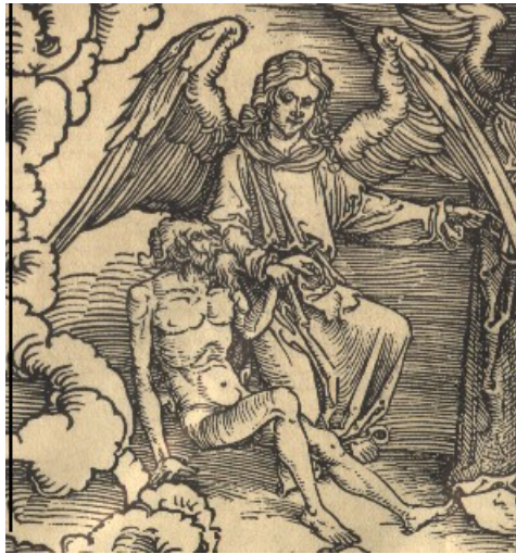
Holzchnitt A. Dürer

Dank für Eure lieb' von Herzen helfen lindern all die Schmerzen eines wehen Körpers Leid