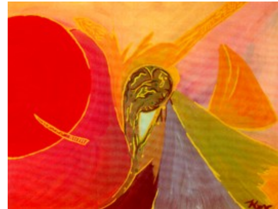
Aquarell Lebenspyramide kk