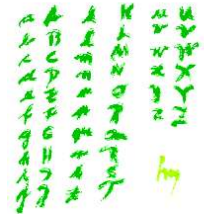
Im Namen Der L i e b e nel nome Dell' a m o r e