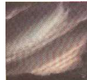
Himmelslichter Alexander v.D.z.V

sie trägt es vor den Altar der Liebe, auf dem es gewandelt wird in Auferstehung - in Ein Leben voller Freude