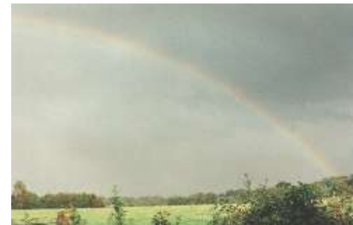
Regenbogen überm Garrensee - Sande foto il