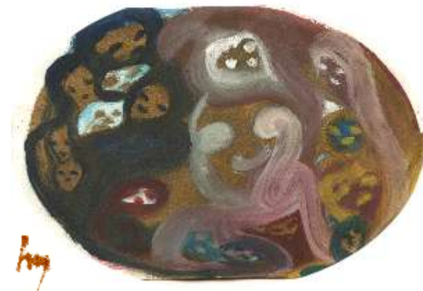
Aquarell Venus - Liebe Danke