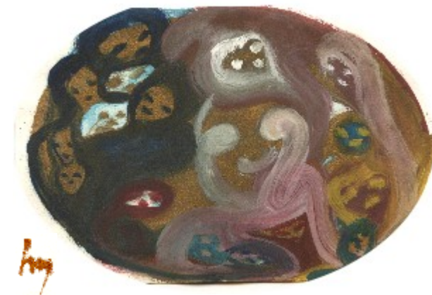
Aquarell Venus - Liebe Danke