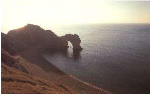
Cliff View - Durdle Door Dorset