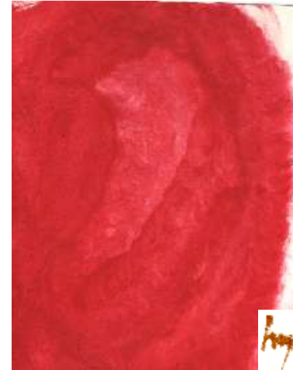
linkes Ohr - Detail aus Herzengel

schöne Töne für Dich aus Ebenen, die für Heilung da sind -