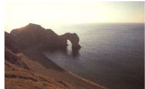
Cliff View, Durdle Door, Dorset, England

Ein Hauch voller Liebe mit dem ICH Dich berühre schwebt über Dir wie der Wind in einem wogenden Ährenfeld - und MEINER Stimme Ruf er - tönt in Deinem Herzen, damit Du Sie weiterleitest in die Ebenen der Erde und allen Wesen schenkst, die ICH zu Dir schicke, die um Heilung bei Dir bitten, die Du nun mit MIR geben kannst