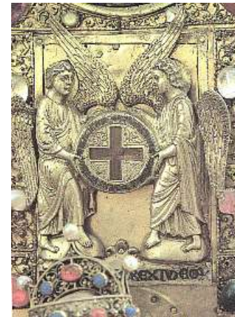
das Heilige Kreuz von Engelberg um 1200 -

die Engel mit der Hauptreliquie, den beiden Kreuzpartikeln