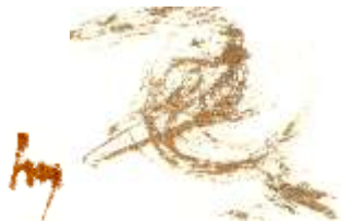
Vogel im Nest

ich kann schon jetzt im Neuen Haus meditieren um eine Verbindung zu schaffen