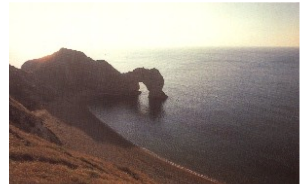
Cliff View, Durdle Door, Dorset, England

Ein Hauch voller Liebe mit dem ICH Dich berühre schwebt über Dir wie der Wind in einem wogenden Ährenfeld - und MEINER Stimme Ruf er - tönt in Deinem Herzen, damit Du Sie weiterleitest in die Ebenen der Erde und allen Wesen schenkst, die ICH zu Dir schicke, die um Heilung bei Dir bitten, die Du nun mit MIR geben kannst