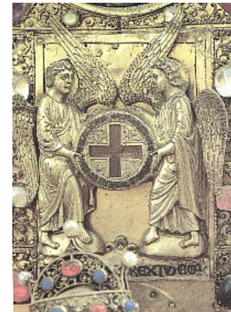
das Heilige Kreuz von Engelberg um 1200 -

die Engel mit der Hauptreliquie, den beiden Kreuzpartikeln