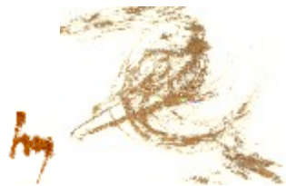
Vogel im Nest

ich kann schon jetzt im Neuen Haus meditieren um eine Verbindung zu schaffen