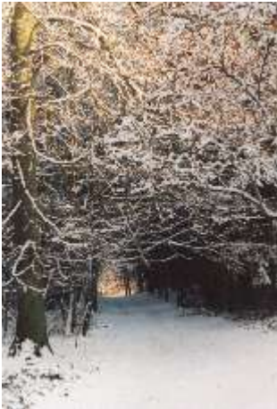
Waldweg Garrensee foto il

Steine rufen: „Tragt mich Heim“ steck sie in mein Säcklein - auch die Zweige wollen mit werde so nun ihr Geschick -