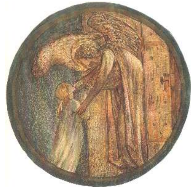
Welcome to the House E. Brune - Jones Danke

Der Heilige Engel bietet Dir einen Raum der Heilung an - öffnet ihn für Dich - lädt Dich ein, nach Deiner Heilung wieder zu Ihm zu kommen und spricht: „Sobald Du Diese Schwelle überschreitest bist Du Alleine - gehe voller Vertrauen dann und Dein Wahres Leben beginnt