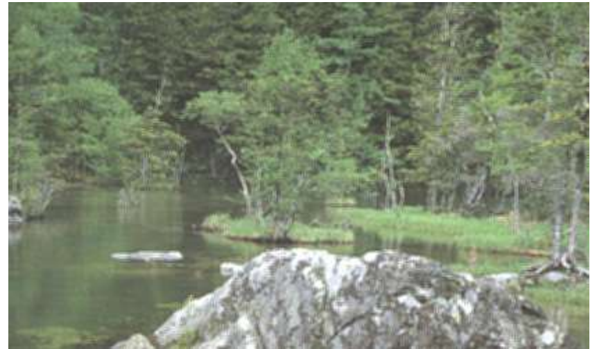
Felssteine im Fluss des Lebenswassers