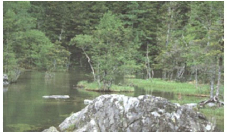
Felssteine im Fluss des Lebenswassers