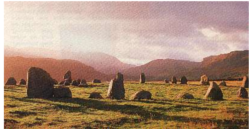
Steinkreis Castlerigg bei Keswick, England