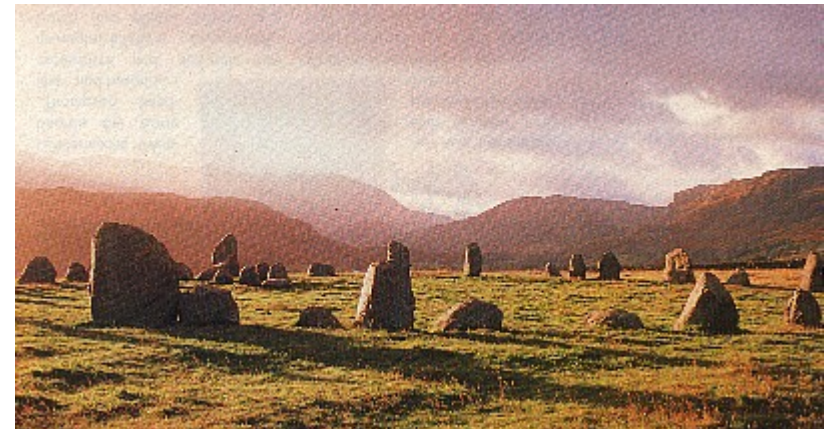
Steinkreis Castlerigg bei Keswick, England