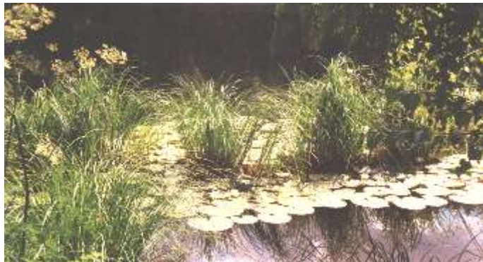
Garrensee - Seerosen

sie mir zu sagen - schreibe sie auf ICH werde sie mitnehmen