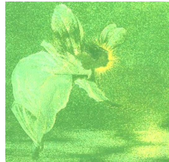
Spirit of the Night

in bunte Schmetterlinge, die Ihre Freude - Zartheit - Leichtigkeit dem Leben - der Welt in Ihrem Tanz schenken