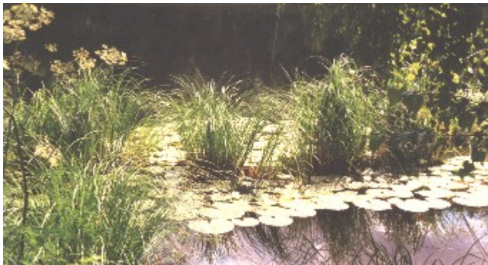
Garrensee - Seerosen

ICH bitte Dich sie mir zu sagen - schreibe sie auf ICH werde sie mitnehmen