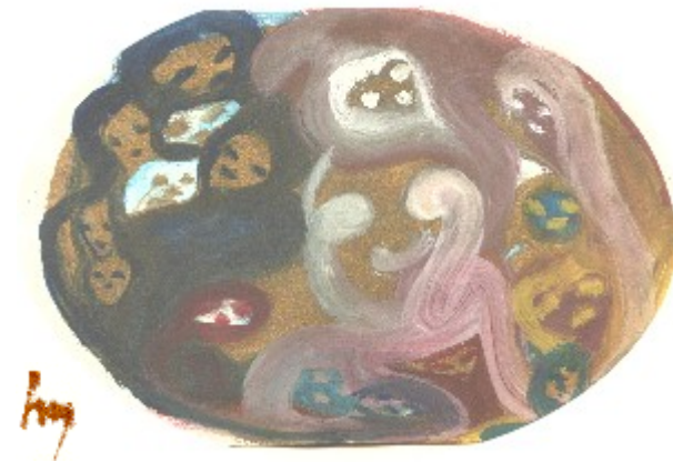
Venus - Liebe

mit meiner Ganzheit bin ich eingehüllt in DEIN ICH BIN