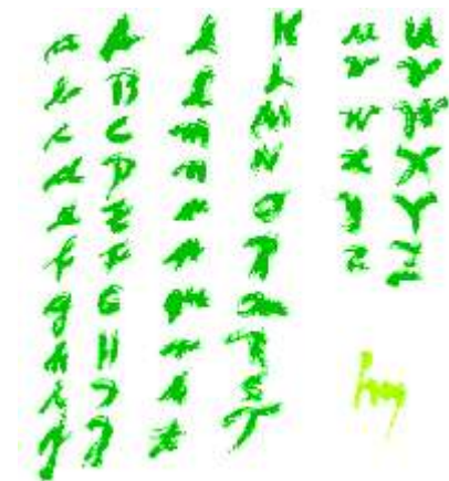
Im Namen Der L i e b e nel nome Dell' a m o r e