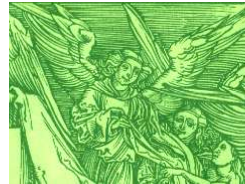
Holzchnitt A. Dürer