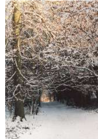
Tannenwald am Garrensee

der Hoffnung auf Leben mit ihm in anderen Zeiten und Räumen - in der Unendlichen L i e b e