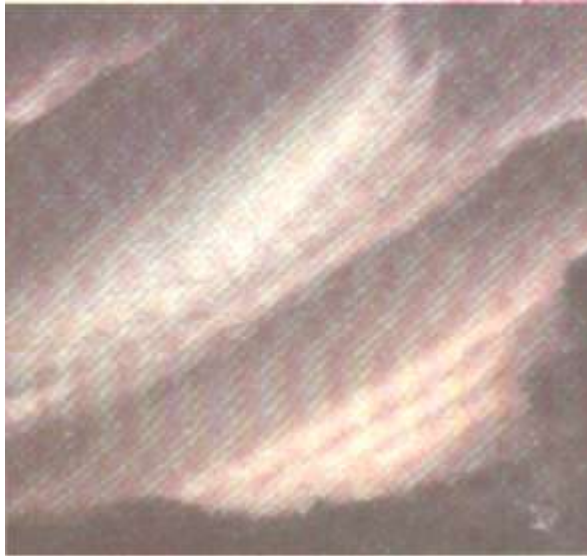
Himmelslichter von Rüdiger - Alexander v -D - z - H