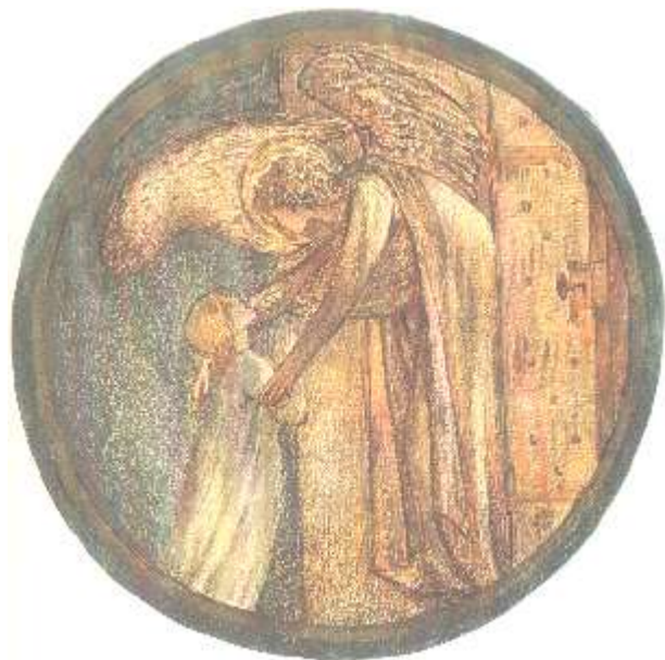
Welcome to the House

Abschied III Begleitung eines Drogensüchtigen