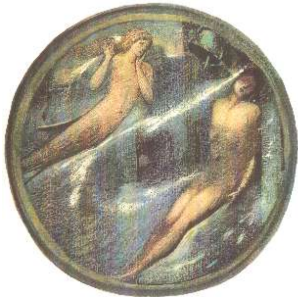
Grave of the Sea Edward Brune-Jones

Wir beten und bitten darum, dass alle diese sehnsuchtsvollen Wünsche sich in Gaben wandeln, deren Erfüllung in der Zeit und in der Ewigkeit Heimat finden - Geborgenheit und deren Ende und Anfang Immersein IST