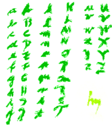
Im Namen Der L i e b e nel nome Dell' a m o r e