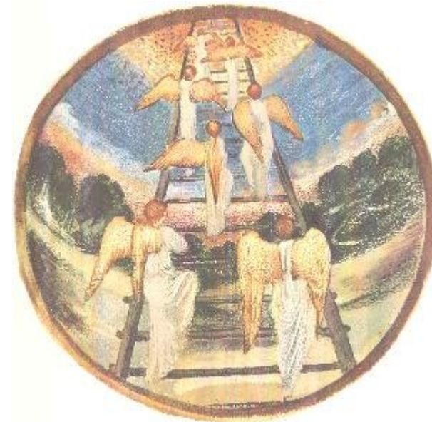
Jakobsleiter Edward Brune-Jones