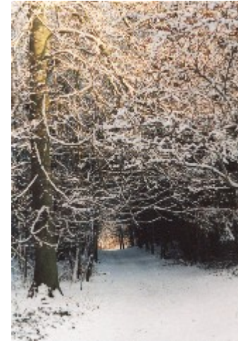
Tannenwald am Garrensee Foto il

Das, was Dich liebt wird auf Dich warten - der Teil des Wesens - der Seele