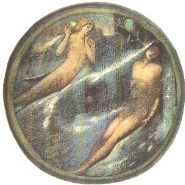
Grave of the Sea Edward Brune-Jones

Wir beten und bitten darum, dass alle diese sehnsuchtsvollen Wünsche sich in Gaben wandeln, deren Erfüllung in der Zeit und in der Ewigkeit Heimat finden - Geborgenheit und deren Ende und Anfang Immersein IST