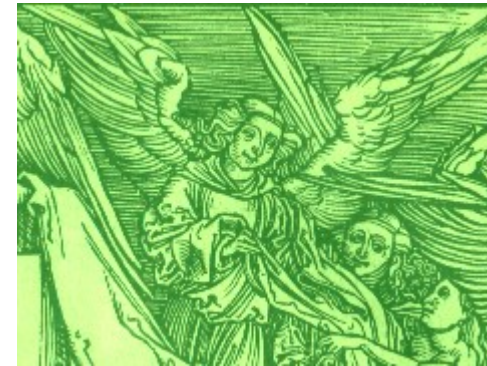
Holzchnitt A. Dürer

DU gibst Deine Seele hin - bringst sie CHRISTUS dar