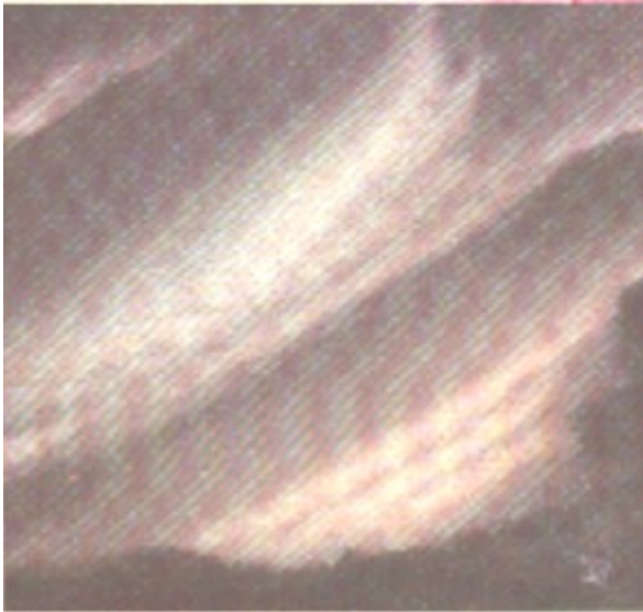
Himmelslichter von Rüdiger - Alexander v -D - z - H