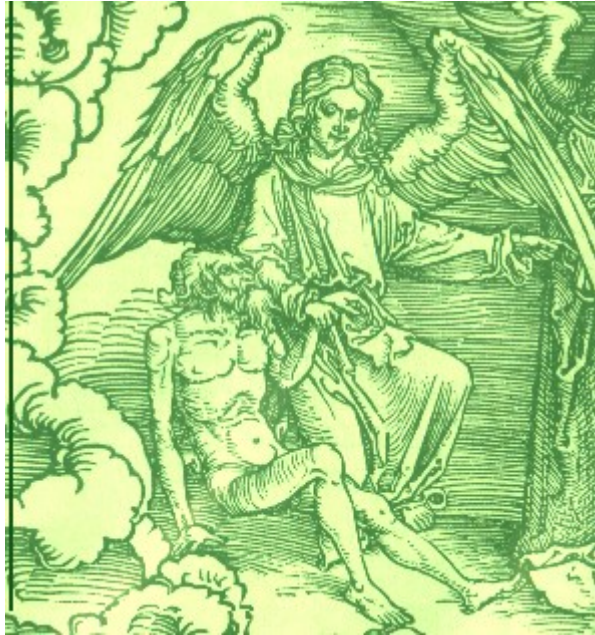
Holzschnitt A. Dürer