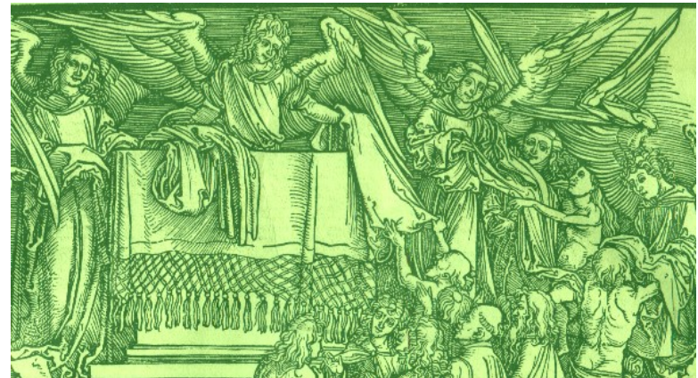
Holzchnitt A. Dürer