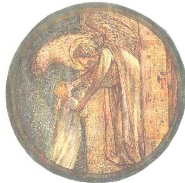
Welcome to the House Bild von Edward Brune-Jones

Dankesagen für alle Hilfen, die ... gerne annimmt