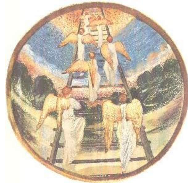
Jakobsleiter Edward Brune-Jones