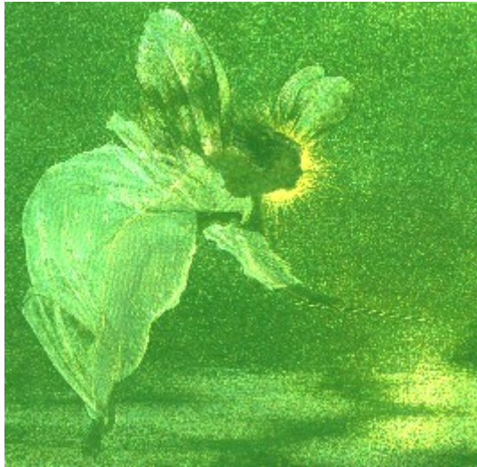
Feenlicht - Spirit of the Night

Wir danken mit einem freudigen Annehmen und Weiterschenken