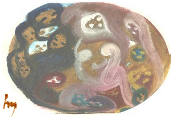
Venus - Liebe

Geburt im Heiligen Gral Gottes ist Bewusstheit des Geistes - Geburt im Heiligen Gral Gottes ist Bewusstheit der Seele - Geburt im Heiligen Gral Gottes ist Bewusstheit des Körpers -