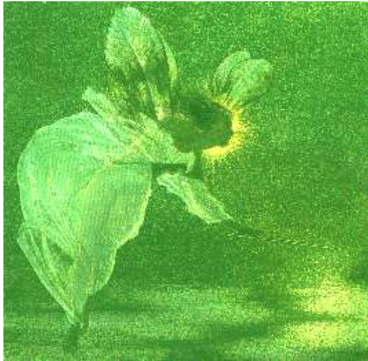
Feenlicht - Spirit of the Night

Wir danken mit einem freudigen Annehmen und Weiterschenken