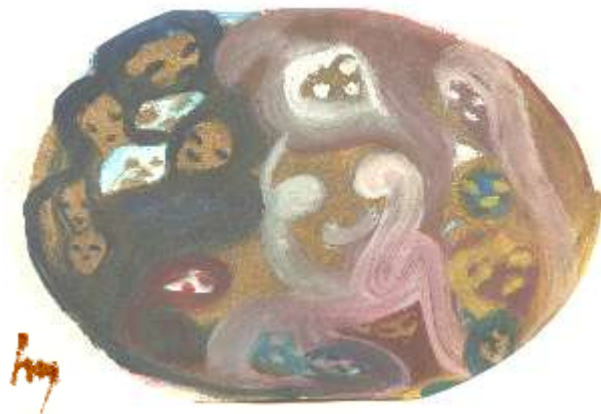
Venus - Liebe