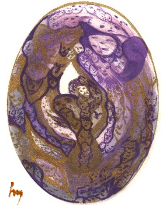
Japan - Mutter