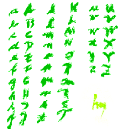
Im Namen Der L i e b e nel nome Dell' a m o r e