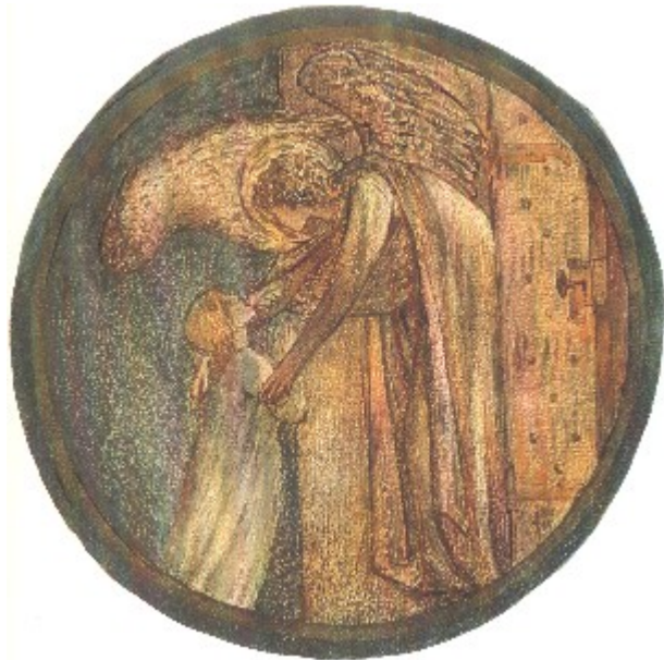
Welcome to the House Edward Brune - Jones

„Sobald Du Diese Schwelle überschreitest bist Du Alleine - gehe voller Vertrauen dann und Dein Wahres Leben b e g i n n t