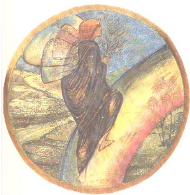
Ladder of heaven