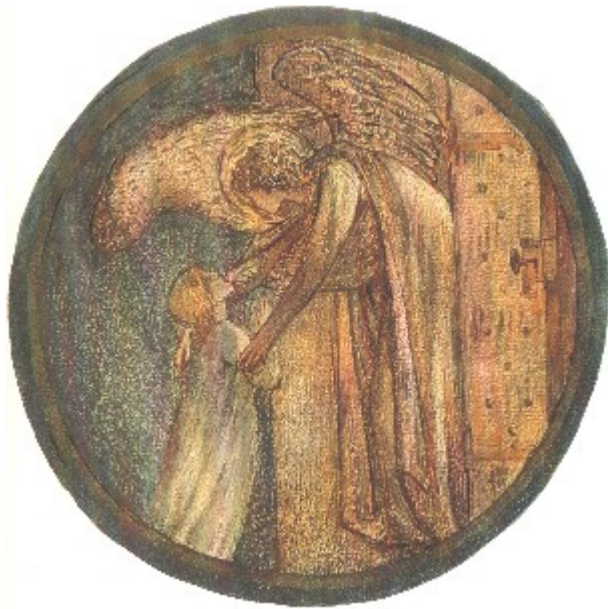
Welcome to the House Edward Brune - Jones