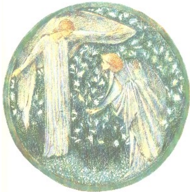
Edward Brune-Jones White Garden die Verkündigung in einem Garten