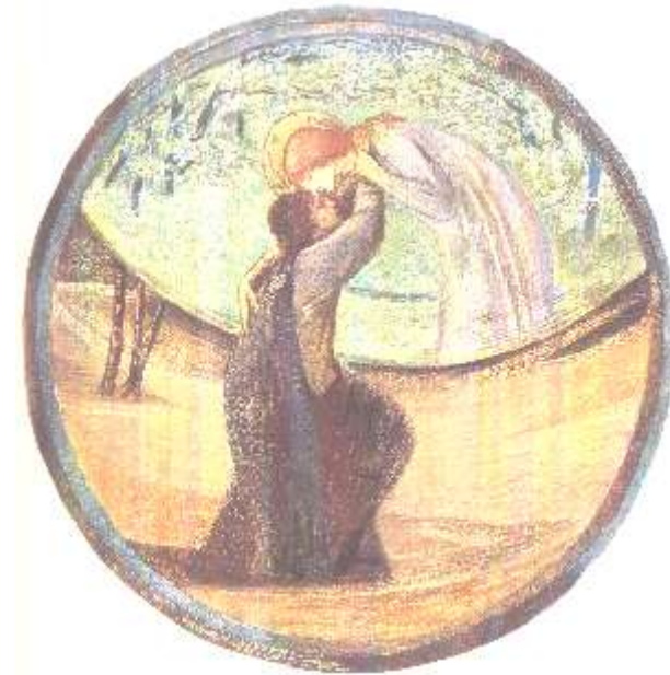
Golden Greeting Edward Brune-Jones

Treffen nach dem Tod mit der Heiligen Seele