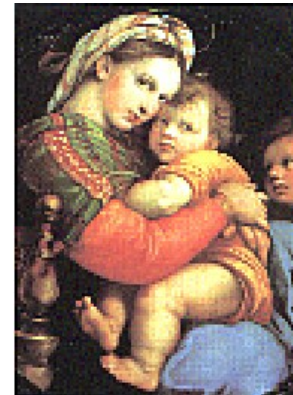
Madonna della seggiola Galleria Palatina - Firenze

Leonardo da Vinci Dürer, Matisse ,Cesan Michelangelo, Chagall, Picasso, Gauguin, van Gogh, Spitzweg Raffaello