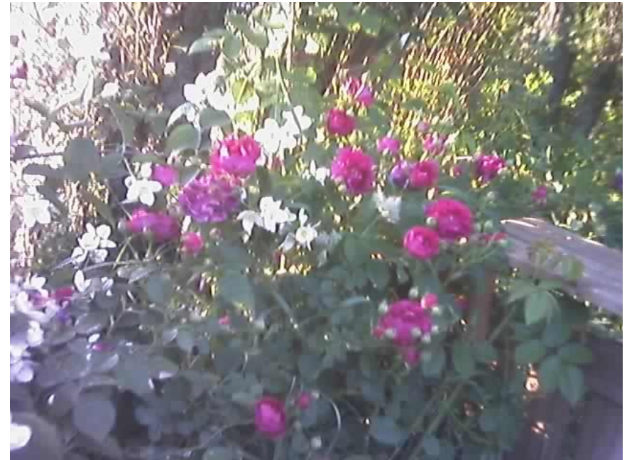
schön duftende Rose in Sande

Freue Dich, dass Du in der Welt bist und zu den Wundern gehörst